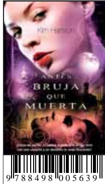
Antes bruja que muerta Kim Harrison