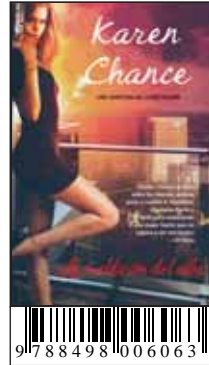
La maldición del alba Karen Chance