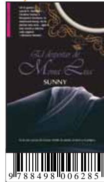
El despertar de Mona Lisa Sunny